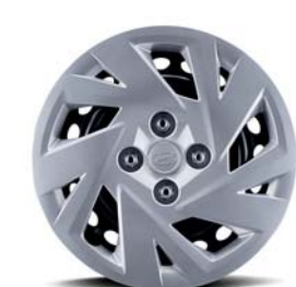
Lantas de acero de 14"