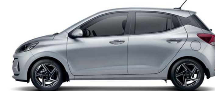
Distancia entre ejes 2,450 Longitud general 3,815