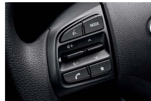
Bluetooth manos libres