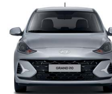
Banda de rodadura* 1,477 Ancho general 1,680