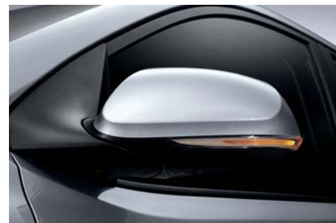
Espejos y repetidores exteriores