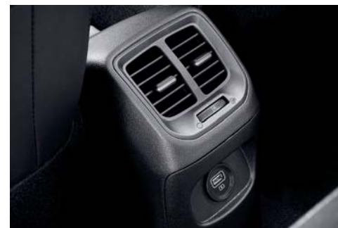
Ventilación de AC en la parte trasera