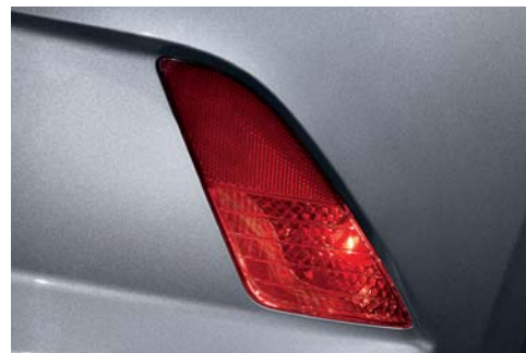
Luz antiniebla trasera