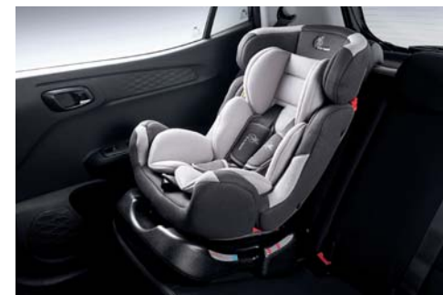
Sistema de anclaje para asientos infantiles ISOFIX