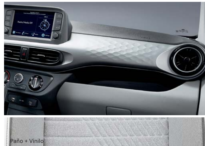
Paño + Vinilo