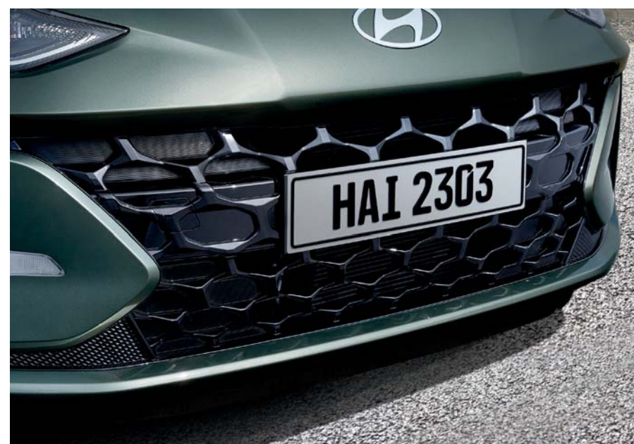
Parrilla del radiador en negro brillante