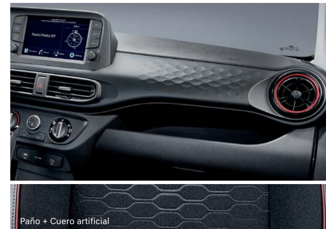
Paño + Cuero artificial