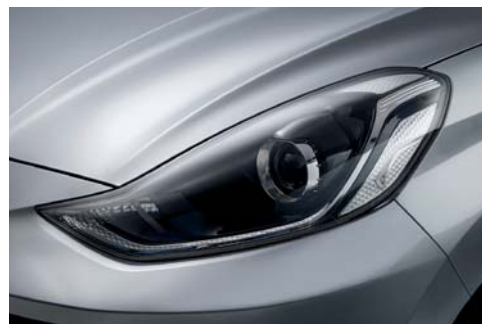
Faros delanteros de proyección