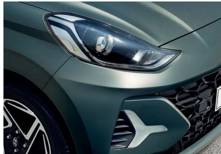
Faros delanteros de proyección / Luces para circulación diurna (DRL) LED