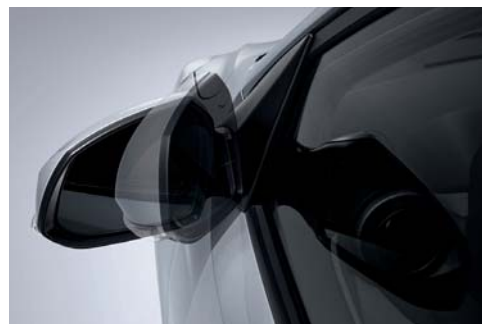
Espejos eléctricos plegables