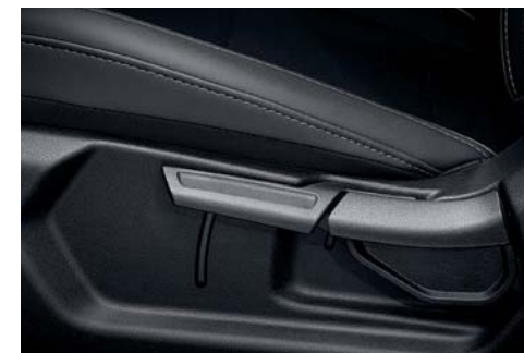
Regulador de altura del asiento del conductor