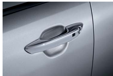
Manijas de puertas cromadas