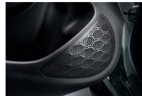
Sistema de cuatro parlantes delanteros/traseros