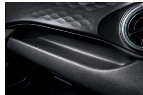
Área de almacenamiento práctica