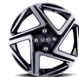
Lantas de aleación de 15"