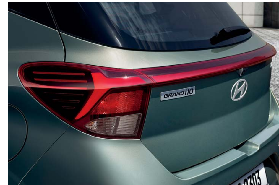
Faros traseros LED

El Grand i10 le lleva a su próxima aventura por carretera con un estilo atrevido y emocionante. Cada detalle amplifica el factor de diversión al volante. Incorpora llantas de aleación de 15 pulgadas y una parrilla más grande y atrevida pintada en negro que llama la atención al instante. Las luces LED añaden una nota de sofisticación de alta tecnología, mientras que el tratamiento de pintura en dos tonos crea una apariencia distintivamente moderna.