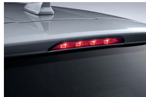
Luz de freno LED colocada en alto