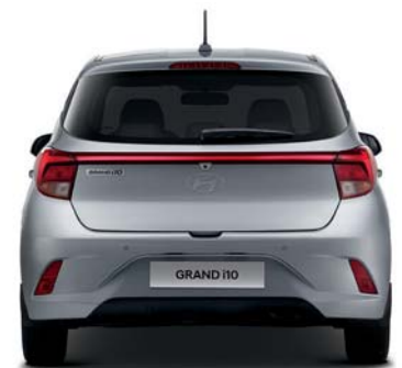
Banda de rodadura* 1,495

Unidad: mm *Rodadura: 14" (delantera y trasera) - 1,489 / 1,507