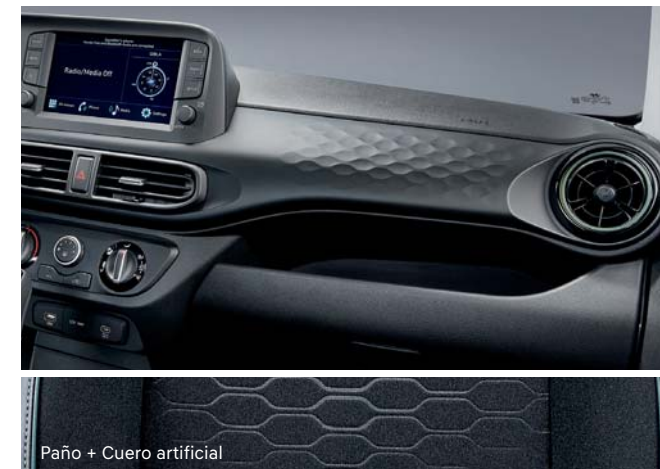
Paño + Cuero artificial