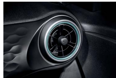
Ventilaciones de AC estilo de hélice única