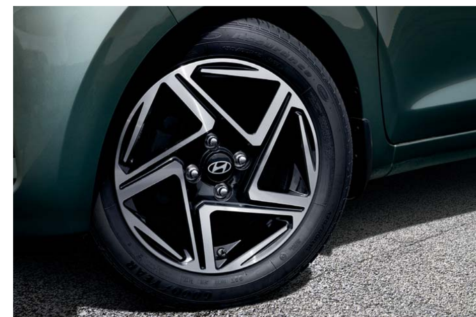
Llantas de aleación de 15"