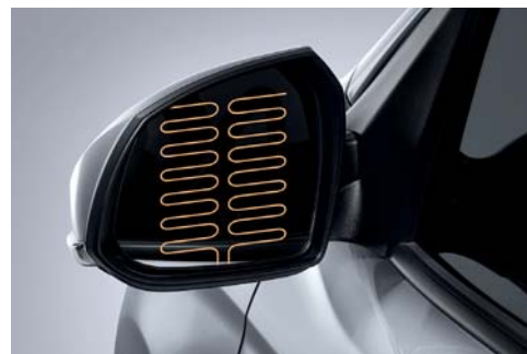
Espejos laterales con calefacción