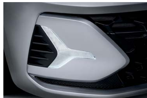
Luces para circulación diurna (DRL) LED